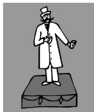
Esbós figurat de la falla de la societat El Iris plantada el 1881

que es va plantar, dins de la seua actual demarcació, en el jardí del Skating-Ring, com el primer antecedent faller de la nostra barriada.