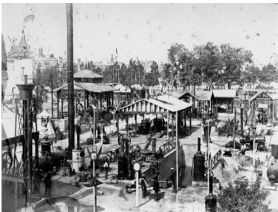
Vista general de l'exposició de motors i màquines elevadores d'aigua de 1880. Al fons esquerre es veuen les torres de Sant Felip i Sant Jaume de l'Albereda

Quatre consiliaris més serien triats per sorteig entre els socis.