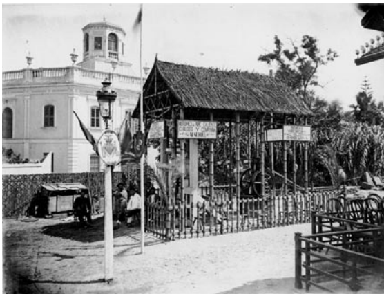
Vista d'un estand de l'exposició de motors i màquines elevadores d'aigua del 1880. Al fons esquerre es veu perfectament el palauet de Monfort

Plaça del Doctor Collado: Representava una escena de la sarsuela Dos princesas . A l'alba es va disparar una traca i una altra abans de procedir-se a la crema de la falla. De quatre a nou de la nit va haver-hi música.