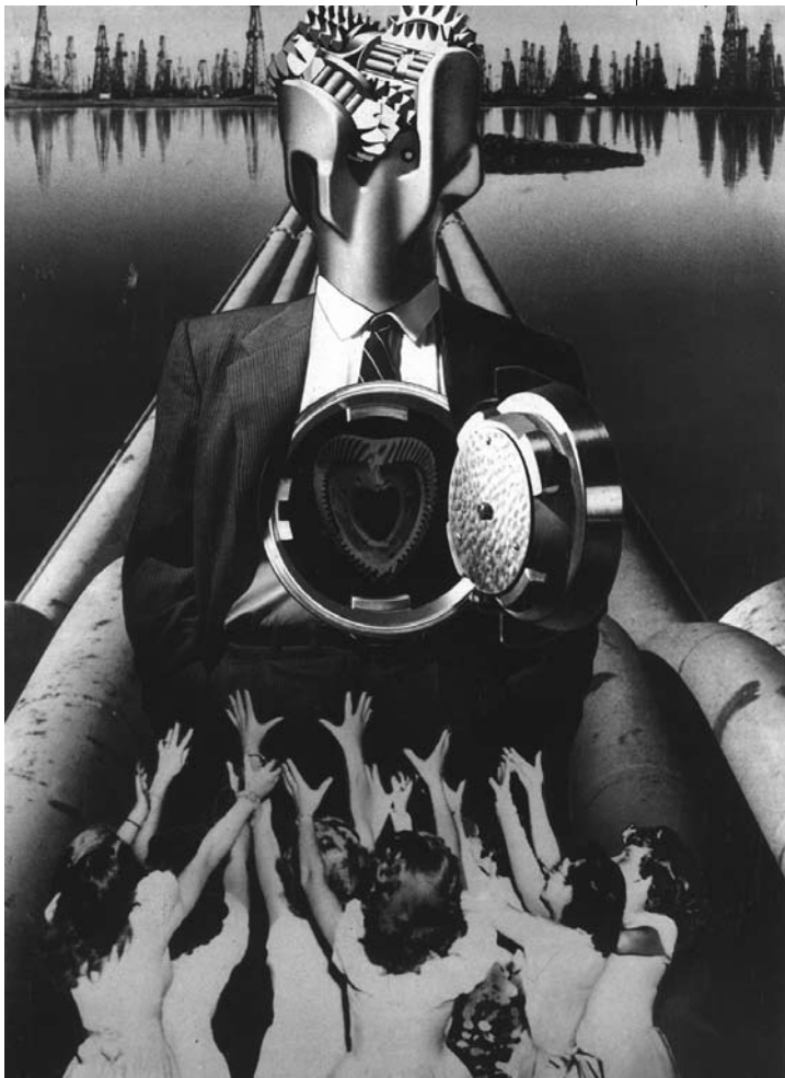
El fascinant rei del petroli

Renau hi estableix una relació ideològica de causa efecte entre les Falles i els interessos socials, econòmics i polítics de les classes