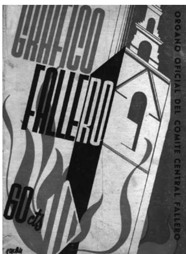
Portada de la revista Gráfico Fallero, 1936