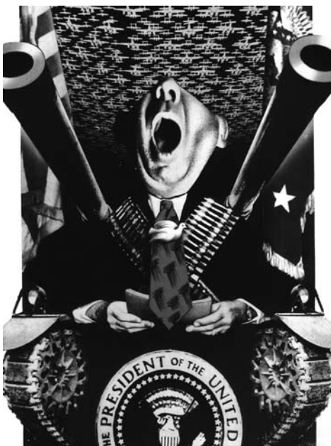
El president parla de la pau

Aixó últim és la clau de tota l'argumentació del Renau lluitador i comunista. Igual que Stalin recorre al vell patriotisme dels pagesos russos per a combatre la invasió nazi, al poble valencià és bo recordar-li que les seues tradicions festives tenen un sentit, una funció revolucionària molt útil en un període de