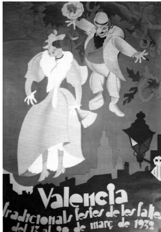
Cartell anunciador de les Falles, obra d'Antoni Vercher

¡També va ser un curiós any pont per a un magnífic cartell de Falles, el del gran Antoni Vercher, presentat a concurs l'any 30 —el primer concurs, de fet—, que, tot i no resultar guanyador, va merèixer un premi extraordinari d'igual quantia; com constata Taula en el seu número 29, del mes de febrer (p. 4). Al 32, estranyament, l' Àlbum Fallero , el llibre oficial, en la pàgina 4, va presentar el mateix cartell, en blanc i negre i amb la retolació corresponent al cartell oficial de l'any, tot i que no ho va ser mai. A l'entremig,