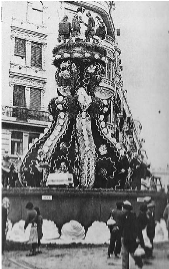
Falla guanyadora del primer premi, obra de Vicent Benedito per a la comissió dels carrers Comte de Salvatierra-Francesc Blanquells

La falla que no té intensió satírica es una falla desllavasá, que produix melenchia, com quant agafes la gripe. A lo pichor es un monument pretensió, una bufa de pato molt unflaeta; el mires y te quedes mes serio que el porrito Cristóbal: ¡ché, qué timo!